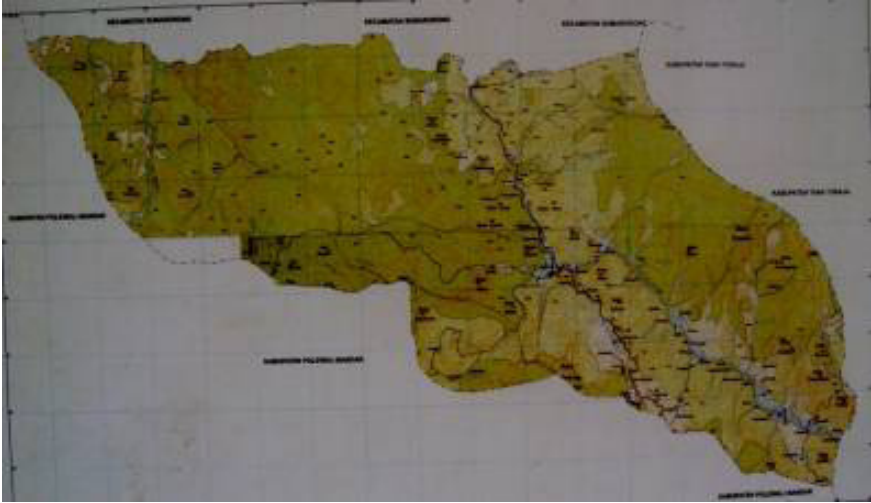
Gambar 2.4 Peta Kecamatan Messawa.

42 dusun serta 2.093 KK. Desa dan kelurahan tersebut, yaitu Kelurahan Messawa, Desa Rippung, Desa Pasapa' Mambu, Desa Makuang, Desa Malimbong, Desa Matande, Desa Sipai, Desa Sepang, dan Desa Persiapan Tondok Batu (lihat Gambar 4). Untuk lebih jelasnya mengenai jumlah penduduk di desa dalam Kecamatan Messawa ditampilkan dalam tabel berikut ini.