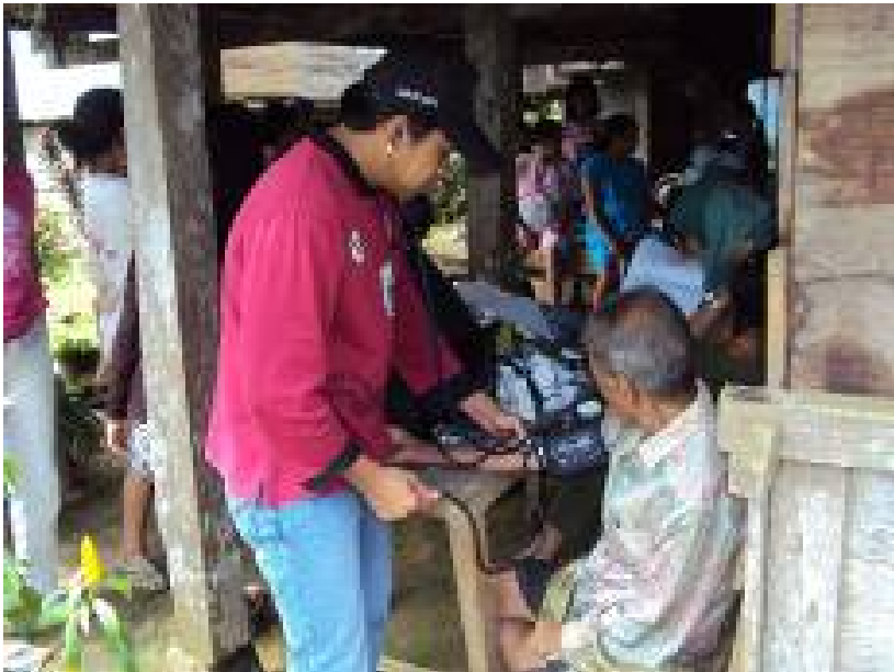
Gambar 2.2 Kegiatan posyandu di Dusun Kondo.

yang ada di Desa Makuang tersebut sudah tidak pernah dipergunakan lagi akibat persoalan sengketa tanah. Maka, sejak tahun 2009, pelaksanaan posyandu di dua tempat itu dilaksanakan di bawah rumah panggung milik penduduk setempat (lihat Gambar 2.2). Berdasarkan penuturan masyarakat dan tokoh-tokoh masyarakat di Desa Makuang, tanah tempat bangunan posyandu, terutama yang terdapat di Dusun Kondo, merupakan tanah milik pribadi mantan kepala desa, sehingga ketika terjadi pergantian pemimpin pemerintahan desa, pihak keluarga mantan kepala desa menggugat tanah tersebut. Sementara tanah tempat bangunan posyandu yang terdapat di Dusun Makuang juga merupakan tanah pribadi milik salah satu warga, sehingga bangunan posyandu yang sebelumnya telah ada dipindahkan ke tempat lain, namun pembangunannya belum selesai hingga saat ini.