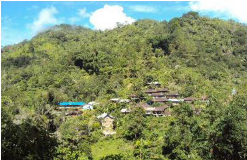
Gambar 2.6 Pola pemukiman di Dusun Dambuala', Desa Makuang.

Deskripsi pola pemukiman penduduk Desa Makuang yang terdiri atas 6 dusun berada di kaki bukit adalah menggerombol (lihat Gambar 2.6) seperti Dusun Dambuala, Kondo, dan Rea. Akan tetapi, 3 dusun lainnya, yakni Dusun Pastil, Tondok Salu, dan Makuang terlihat berpencar memanjang mengikuti arus jalan poros yang membelah Desa Makuang. Sebagian rumah berada di lereng bukit, di pinggir jalan, dan sebagian berada di dekat persawahan atau kebun tanaman kopi. Sementara akses jalan menuju rumah-rumah penduduk berupa jalan tanah setapak yang sempit dan sebagian sudah diurug dengan batu kerikil. Akan tetapi, dengan bantuan PNPM, sebagian jalan di lingkungan dusun sudah bagus karena dikeraskan dengan semen.