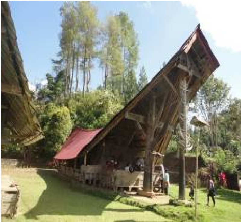
Gambar 2.8 Tongkonan (rumah adat) di Desa Makuang.

Rumah adat tersebut sekarang sudah tidak dihuni lagi oleh pemangku hadat ( Tomakaka ). Bangunan tersebut tidak lagi sebagai rumah tinggal penduduk atau ketua adat, namun dilestarikan sebagai cagar budaya. Biaya perawatannya dibantu oleh Dinas Kebudayaan dan Pariwisata. Berhubung keberadaan hukum adat di Desa Makuang masih dijunjung tinggi, maka rumah adat tersebut juga masih berfungsi sebagai pengadilan adat dan tempat berkumpul para tokoh adat di Makuang (lihat Gambar 2.8 dan 2.9). Semua permasalahan di masyarakat, termasuk pelanggaran, dimusyawarahkan di tempat ini dan apabila tidak dapat diselesaikan secara adat barulah kemudian diserahkan kepada pemerintah.