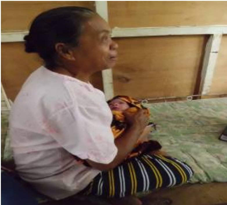
Gambar 3.12 Nenek mengasuh sang cucu.