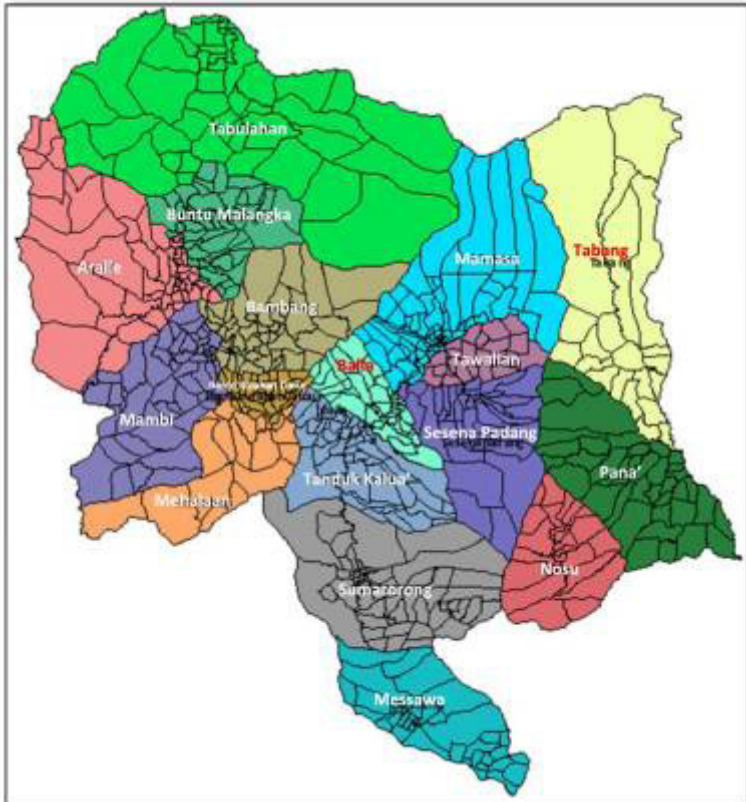
Gambar 2.3 Peta Kabupaten Mamasa.

Secara administratif, Kabupaten Mamasa memiliki batas-batas wilayah yaitu: sebelah utara dan barat berbatasan dengan Kabupaten Mamuju, sebelah timur berbatasan dengan Provinsi Sulawesi Selatan, dan sebelah selatan berbatasan dengan Kabupaten Polewali Mandar. Untuk menuju Kabupaten Mamasa ada tiga alternatif, yaitu 1) jalur darat dari Mamuju ibu kota Provinsi Sulawesi Barat, melewati Majene dan Polewali Mandar sekitar 286 km, 2) dari Mamuju melewati Salu Batu-Aralle-