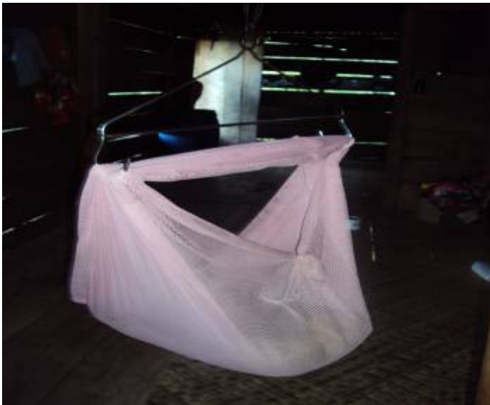
Gambar 3.13 Bayi tidur di ayunan.

Cara merawat bayi berumur kurang dari 1 tahun tidak berbeda jauh dengan cara merawat bayi neonatus, yakni dengan memandikannya setiap pagi antara pukul 8.00-9.00 dan sore pada pukul 15.00 dan diberikan perlengkapan pakaian. Bagi bayi mulai berumur 6 bulan akan diberi makanan berupa bubur nasi yang dicampur sayur dari daun ubi atau bayam. Anak yang sudah tidur biasanya oleh ibunya ditaruh di ayunan supaya tidurnya nyenyak. Setiap hari bayi dijaga atau diasuh oleh ibunya sendiri, anggota keluarga yang lain, atau nenek. Pada usia tersebut anak juga mulai diperkenalkan mainan yang bisa berbunyi.