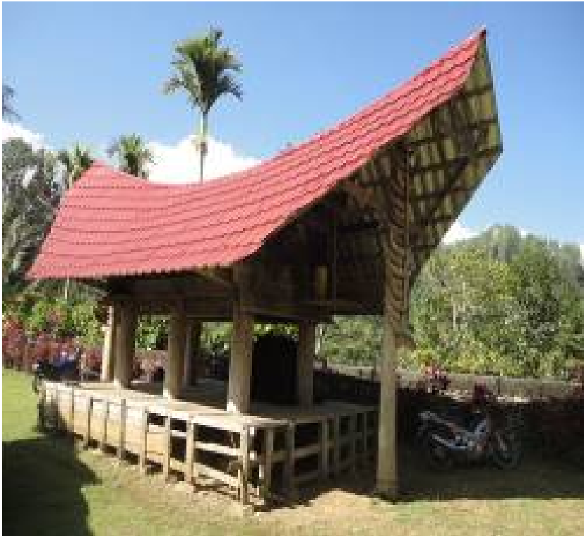
Gambar 2.9 Alang (lumbung) dari tongkonan.

Secara ekonomi kemampuan penduduk tidak sama sehingga luas pekarangan yang mereka miliki juga berbeda-beda. Rata-rata luasnya di atas 500 m 2 , sedangkan bangunan yang mereka tempati rata-rata luasnya sekitar 7 x 12 m 2 , tetapi ada yang lebih besar dari itu.