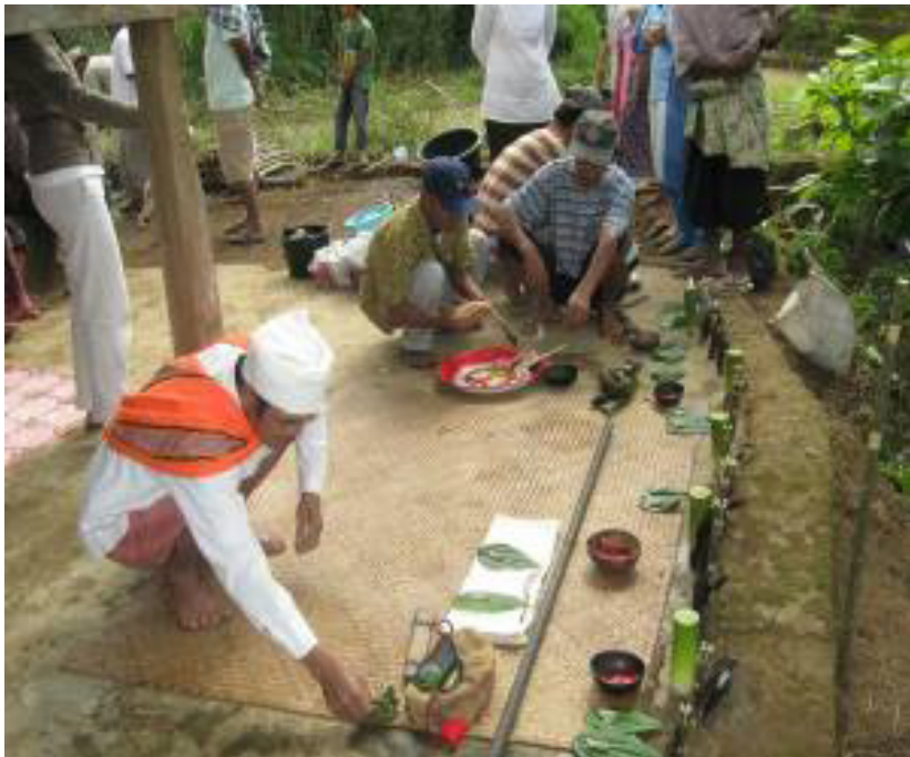
Gambar 2.10 Upacara Manukappa '.

Upacara ini dilaksanakan di Balla (salah satu perkampungan di Dusun Tondok Salu) yang merupakan salah satu tempat ritual pemeluk ajaran Aluk Todolo. Upacara dipimpin oleh Tomammang (yang melaksanakan tata upacara) dan dilakukan dua kali setahun, yaitu pada bulan ke-6 dan bulan ke-12. Semua pemeluk kepercayaan Aluk Todolo melaksanakan upacara tersebut untuk meminta keselamatan. Dalam upacara tersebut mereka yang hadir membawa beras untuk dimasak ke dalam bambu atau disebut dengan ma'doda dan membawa bermacam-macam jenis ayam sebagai persembahan kepada para dewa (lihat Gambar 2.10).