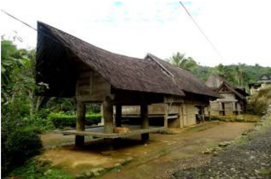
Gambar 2.7 Banua dan alang di Dusun Dambuala.

Rumah adat atau yang biasa disebut tongkonan , yaitu rumah besar yang dibangun bagian atap menyerupai kapal. Rumah adat terdiri atas dua bagian, yang pertama adalah bangunan induk ( tongkonan ); dulu untuk tinggal ketua adat, dan yang kedua adalah bangunan lumbung ( alang ); dulu untuk menyimpan padi dan benda pusaka, serta bagian bawah untuk duduk-duduk tamu yang datang (lihat Gambar 2. 7). Bagian depan tongkonan ditopang dengan tiang tinggi yang terbuat dari batang kayu besar yang berkualitas ( uru ) dan ditaruh tanduk kerbau berjejer menjulang ke atas. Tanduk kerbau tersebut merupakan simbol yang menandakan bahwa keluarga yang tinggal di rumah tersebut pernah melakukan upacara kedukaan (kematian) dan rumah tersebut pernah