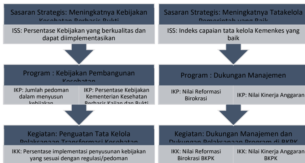
Gambar 3 kerangka logis cascading sasaran strategis, program dan kegiatan Sekretariat BKKP

Dalam melaksanakan program dan anggaran setelah keluar Renstra Revisi 2020-2024 maka pengukuran kinerja Sekretariat BKKP mengacu pada kerangka logis Cascading Sasaran Strategis, Program dan Kegiatan sebagai berikut: