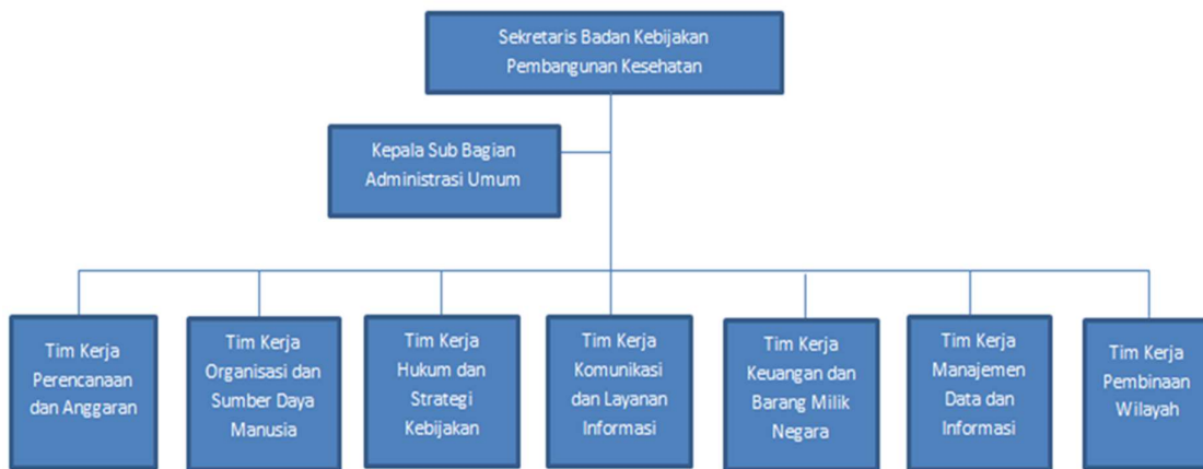
Gambar 1 Struktur Organisasi Sekretariat BKPK

Adapun rincian tugas Sub Bagian Administrasi Umum (berdasarkan Permenkes Nomor 5 Tahun 2022) dan masing-masing Tim Kerja (berdasarkan Keputusan Sekretaris Badan Kebijakan Pembangunan Kesehatan Nomor HK.02.03/H.I/889/2023) adalah sebagai berikut: